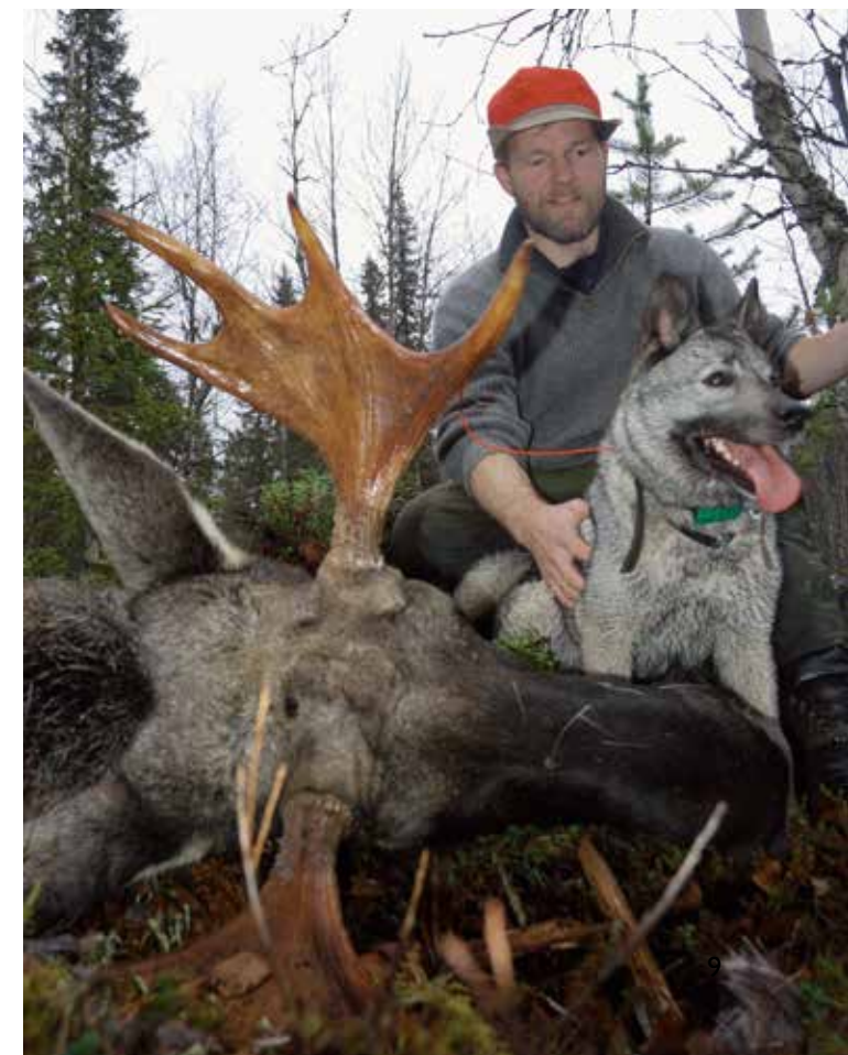
Under: Her har artikkelforfatteren hatt suksess på elgjakt med bruk av Norsk elghund grå som løshund.

På Wikipedia er ordet «avl» definert som «planmessig ledelse av dyrs formering». Avlsarbeid er å velge ut de beste avlsdyr som foreldre til neste generasjon. Ved at de beste dyrene blir foreldre til neste generasjon, får vi avlsframgang. Det vil si at neste generasjon i gjennomsnitt er bedre enn forrige generasjon. For å få dette til, må hundenes egenskaper måles og det er det som skjer på jaktprøver. Ved å måle mange hunder, får en god statistikk å bygge avlen på. For avlen bygger ikke bare på foreldredyrene, men på dyr som er i nær slekt. At vi har gode jakthunder, avhenger derfor av at ikke bare de som driver avl eller har interesse for jaktprøver får hundene sine bedømt, men at flest mulig hunder som er gode nok, går prøve.