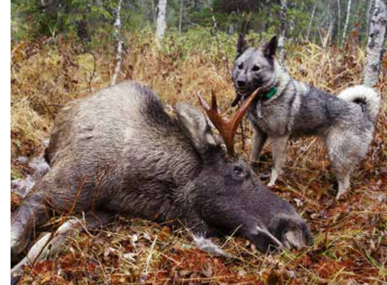
Norsk elghund grå er blitt forbigått i premiegrad av Jämthund i Finland. Det er nok en vesentlig årsak til jämthundens økende popularitet. Det kan være ett varsel for denne nasjonalrasen vår som løshund.