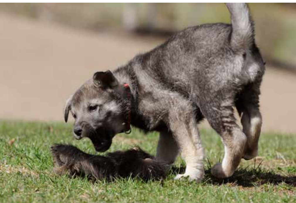
Elimon Salon Leia var alt fra tidlig valpestadie prega på lukt av bjørn og leker uanstrengt med bjørnelabben.