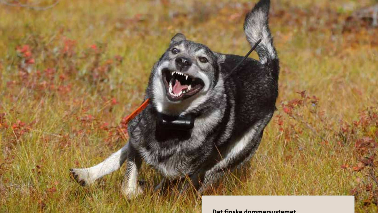
Målet for avlen er å få hunder med fart i, slik som ØS Syrran viser fram her.

finske avlen. Det var en oppdatert og oversatt versjon av denne artikkelen som sto på trykk i Elghunden 3-14. Under vårt besøk hos Jukka fikk vi diskutert noe av dette ytterligere.